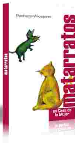
Cuarta Publicación. Autor: Alumnos del I.E.S.O. Hernández Pacheco y del I.E.S.O. Al-qazeres. Ilustraciones: Alumnos del I.E.S.O. Hernández Pacheco y del I.E.S.O. Al-qazeres.