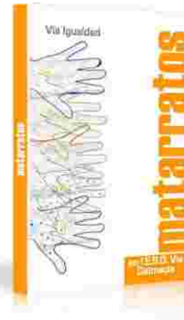
Tercera Publicación. Autor: Alumnos I.E.S.O. VÍA DALMACIA. Ilustraciones: Alumnos I.E.S.O. VÍA DALMACIA.