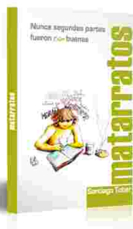
Quinta Publicación. Autor: Santiago Tobar. Ilustraciones: Patxidifuso.